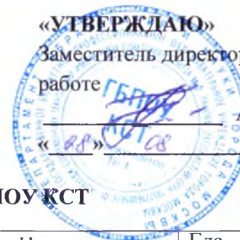
График проведения инструктажей с обучающимися в ГБПОУ КСТ