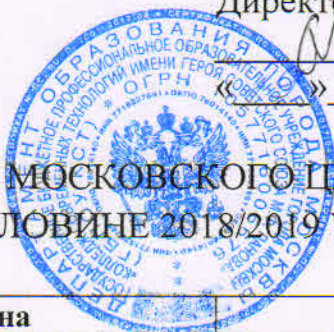
ГРАФИК ДИАГНОСТИК МОСКОВСКОГО ЦЕНТРА КАЧЕСТВА ОБРАЗОВАНИЯ В I ПОЛОВИНЕ 2018/2019 УЧЕБНОГО ГОДА