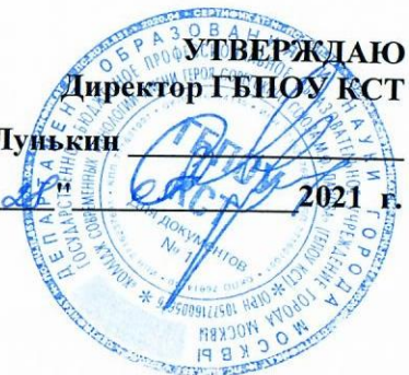
ГРАФИК проведения ГИА учебный корпус № 1 "Лосиноостровский"